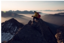
Markus Kröll auf der Berliner Spitze.