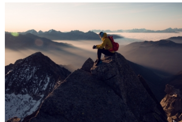
auf der Berliner Spitze.

In der Nähe zieht ein Tiroler Urgestein seine Spur durch den hochalpinen Schnee – denn in den Zillertaler Bergen kann es auch im Spätsommer schneien. Bergsteiger-Legende Peter Habeler ist ein gebürtiger Zillertaler hat weltweit schon viele gefährliche Abenteuer bestanden. Doch es zieht ihn immer wieder zurück zu seinen Wurzeln. Der mächtig aufragende Olperer war der erste 3000er, den Habeler als junger Bub bestieg.