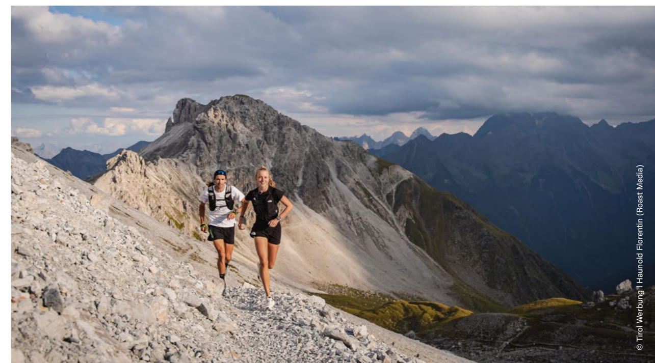
Neustift im Stubaital, Kalkkögel, Seejöchel

Mayrhofen Ultraks | Mayrhofen, 08.–09.09.2023