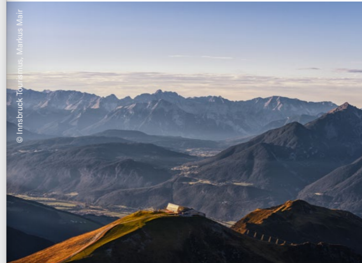
Axamer Lizum, Hoadl

Algunos lo llaman “Salfeins See”, otros “Schönangerlsee”. Este lago de montaña se ha hecho famoso por su impresionante reflejo del Kalkkögel , y en los meses de verano se pueden hacer fotos especialmente bonitas. Además, la vista aquí se extiende desde Innsbruck y el valle del Inntal, hasta la cadena Mieminger y las montañas Karwendel, hasta el Zugspitze.