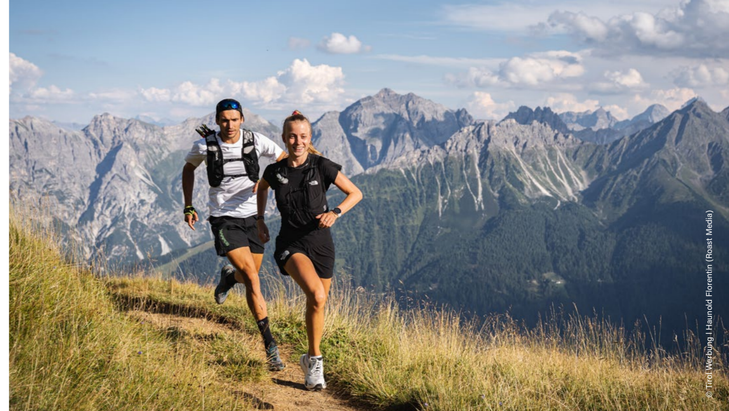
Neustift im Stubaital, cerca de Starckenburger Hütte