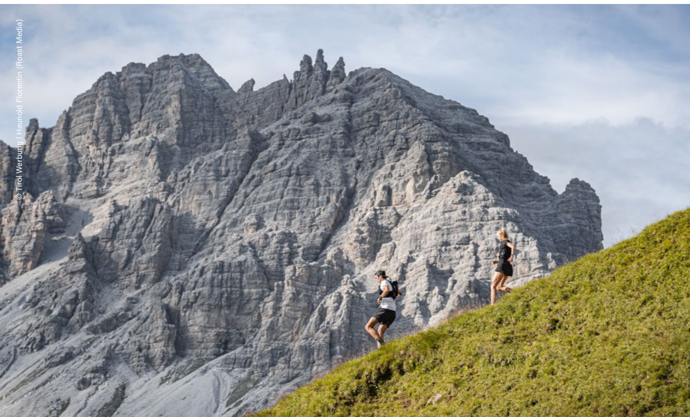
Neustift im Stubaital, cerca de Starkenburger Hütte