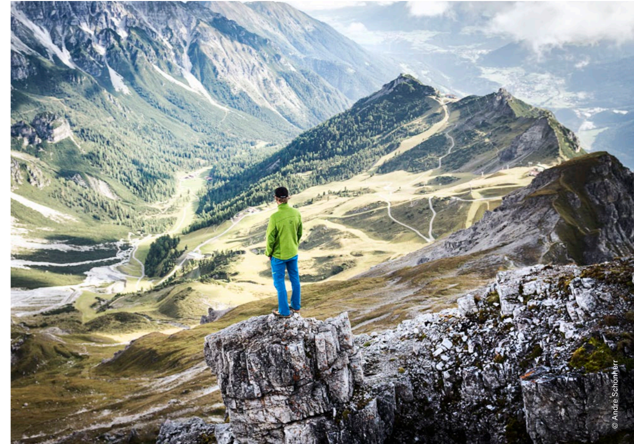
Telfes im Stubai, Schlick 2000