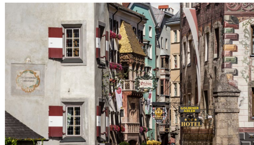
El casco antiguo de Innsbruck

Esplendor barroco del casco antiguo e imponentes formaciones calcáreas: El segundo día de la carrera no podría ser más variado. Entre el punto de salida delante teatro Landestheater de Innsbruck y el centro del pueblo de Neustift im Stubaital como punto de llegada, aguardan muchos futuros nuevos lugares favoritos a lo largo de la ruta de 45 kilómetros y los 3.132 metros de desnivel.