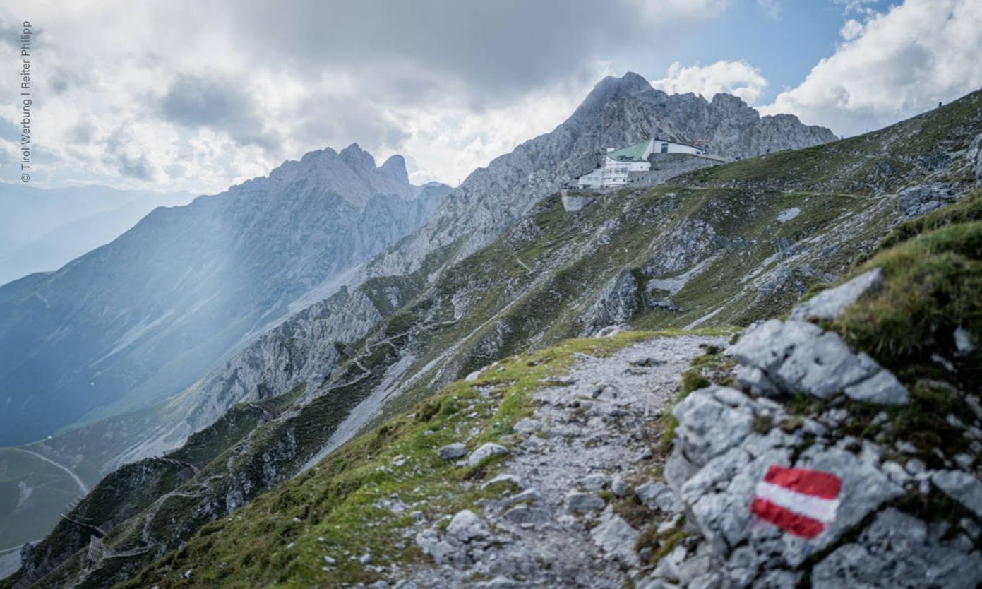
La cordillera Nordkette, Hafelekar