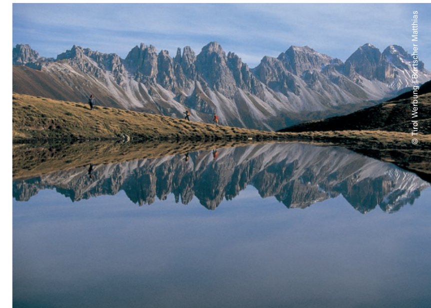
Sellrain, Lago Salfeins See