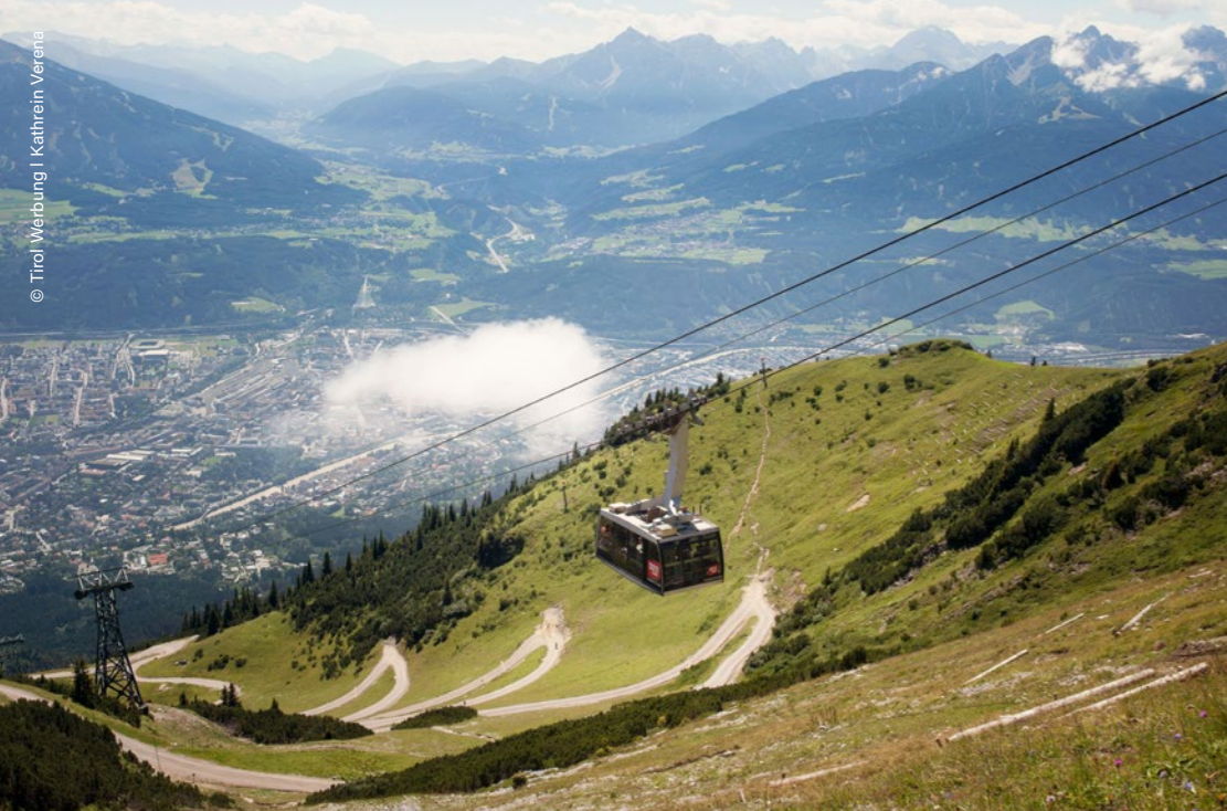
Innsbruck, Funicular Nordkettenbahnen