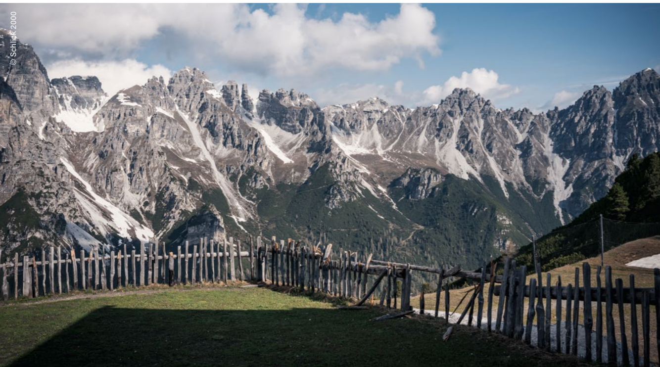
Telfes im Stubai, Kalkkögel, Schlick 2000

Uno de sus conquistadores más famosos: Sir Edmund Hillary.