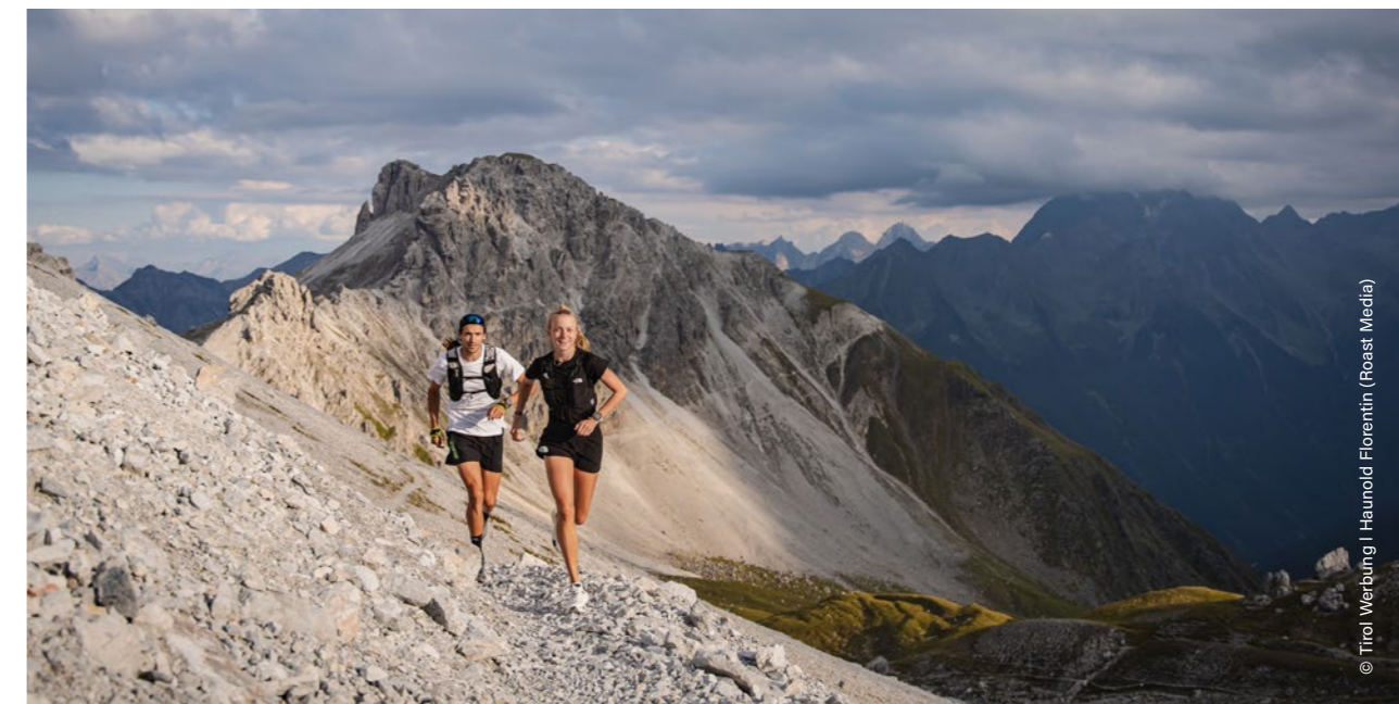
Neustift im Stubaital, Kalkkögel, Seejöchel

Mayrhofen Ultraks | à Mayrhofen, les 8 et 9 septembre 2023