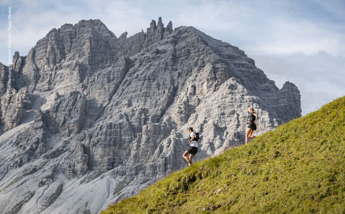
Neustift im Stubaital, près du refuge Starkenburger Hütte