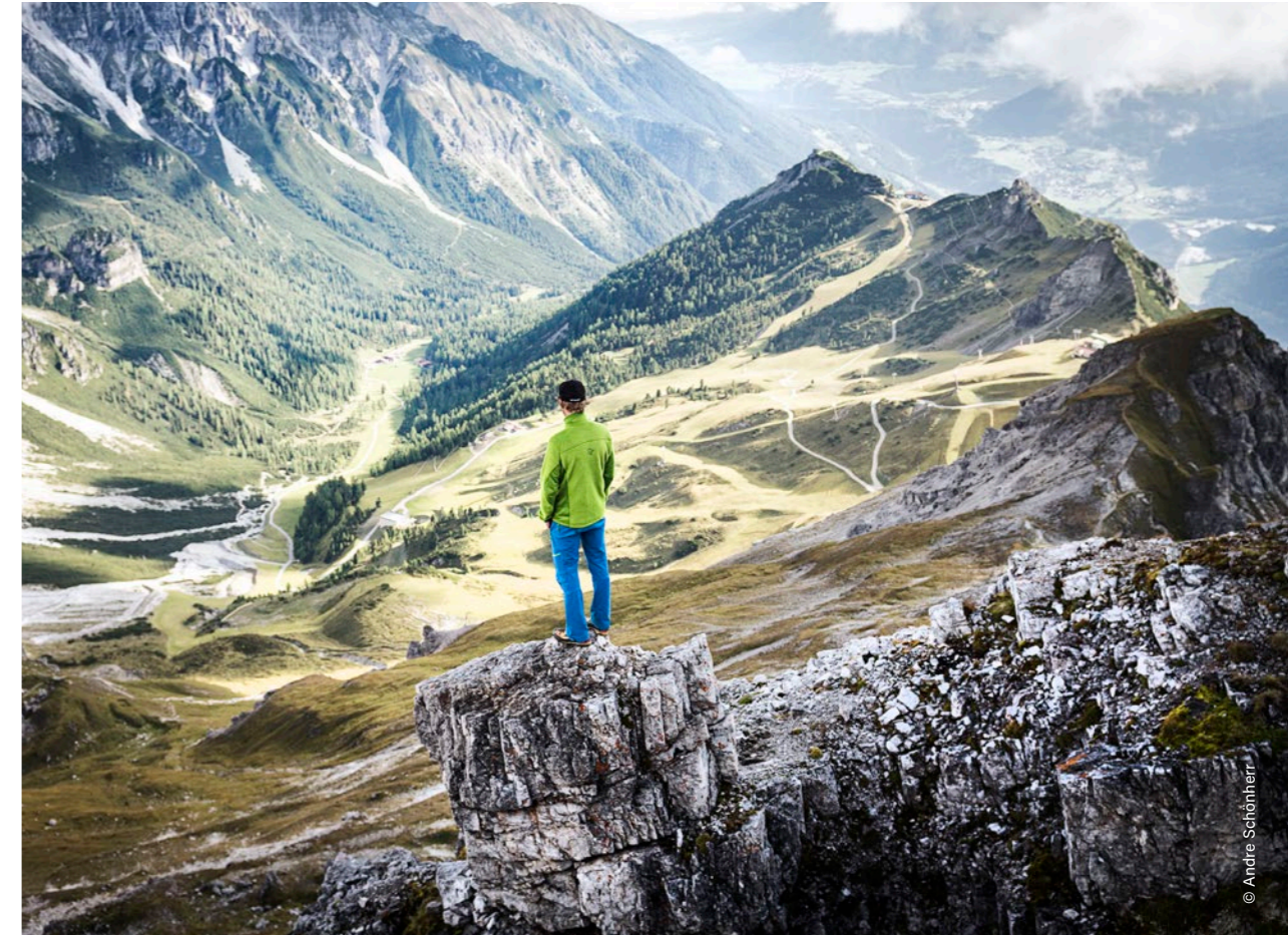
Telfes im Stubai, Schlick 2000