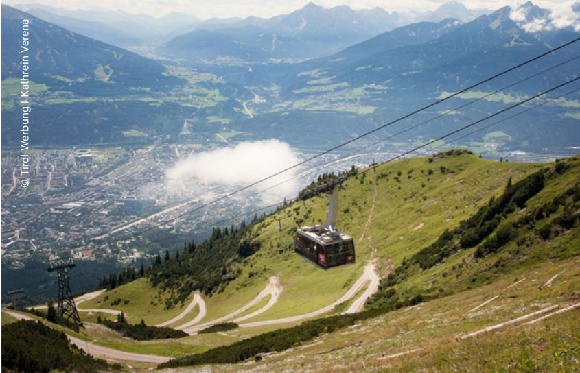
Innsbruck, les remontées mécaniques Nordkettenbahnen