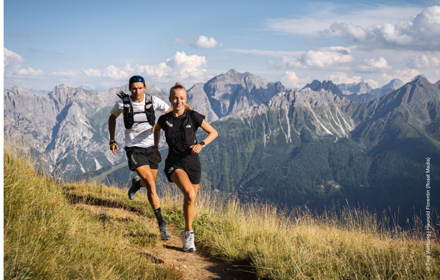
Neustift im Stubaital, près du refuge Starckenburger Hütte