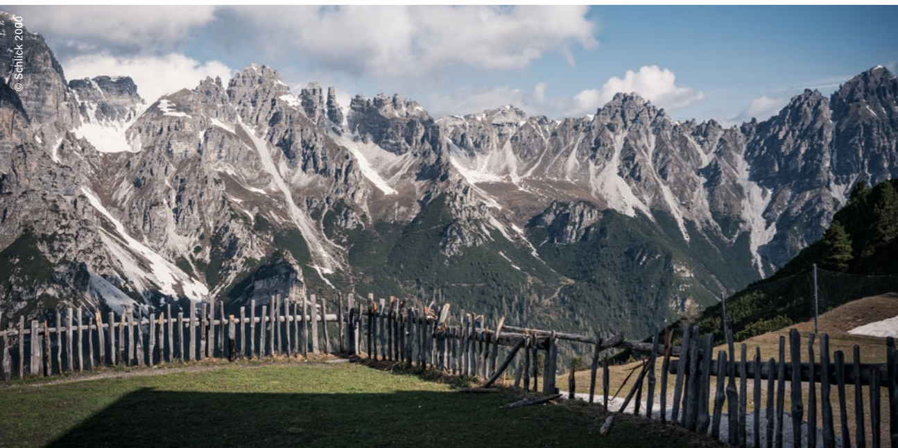
Telfes im Stubai, Kalkkögel, Schlick 2000

Véritable eldorado pour les férue·e·s de sport, été comme hiver, Schlick 2000 se trouve à seulement dix minutes d'Innsbruck. Le domaine s'étend sur les versants de la belle haute-vallée de Schlick jusqu'au col de Kreuzjoch à 2140 mètres d'altitude. En hiver, on trouve ici 19 pistes réparties sur 22 kilomètres . En été, on apprécie les randonnées à thèmes et les chemins de randonnée adaptés aux familles, comme le Baumhausweg ou le Scheibenweg. La station supérieure se situe à 2136 mètres d'altitude ; elle est dominée par les impressionnantes Kalkkögel. 500 mètres de dénivelé plus haut se trouve le sommet Hoher Burgstall, un des Stubai 7 Summits . Parmi ses conquérants les plus célèbres, on peut citer Sir Edmund Hillary.