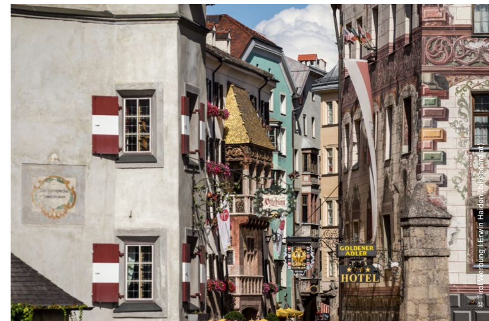
La vieille ville d'Innsbruck

Splendeur baroque de la vieille ville et imposantes formations calcaires : le deuxième jour de course ne pourrait être plus varié. Entre le point de départ au théâtre régional d'Innsbruck et le centre du village de Neustift, les coureur·euse·s côtoient, tout au long de ces 45 kilomètres et 3132 mètres de dénivelé, différents lieux passionnants.