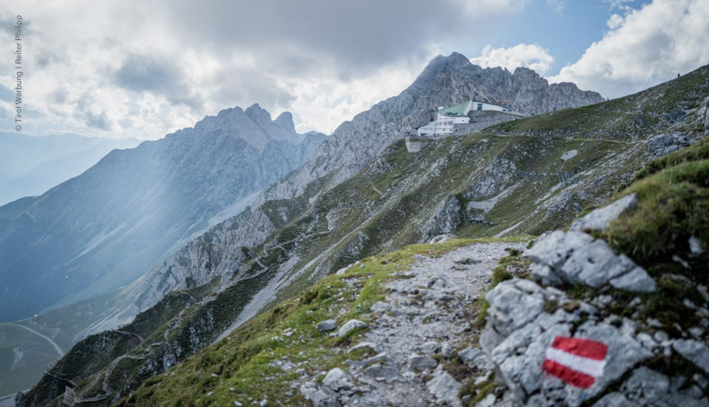
La Nordkette, Hafelekar