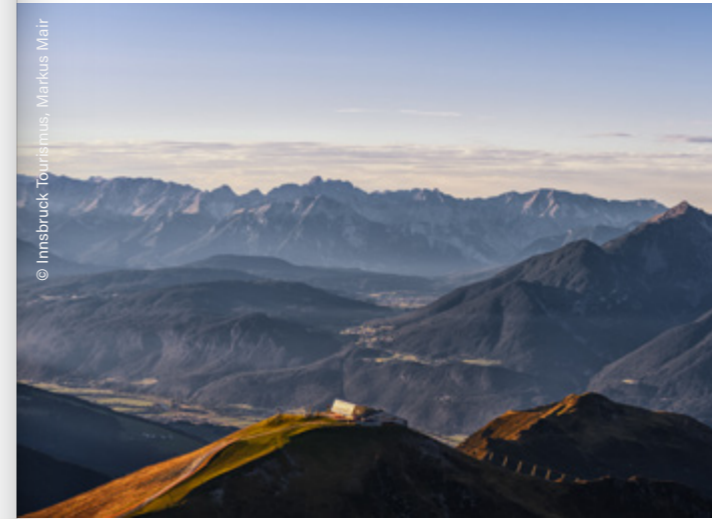
Axamer Lizum, Hoadl

Alcuni lo chiamano “Salfeins See”, altri “Schönangerlsee”. Questo lago di montagna è diventato famoso per i riflessi mozzafiato delle cime del Kalkkögel , bellissimi da fotografare specialmente durante i mesi estivi. Inoltre, la vista spazia da Innsbruck e la valle dell’Inntal, alla catena di Mieming e al Karwendel, fino alla Zugspitze.