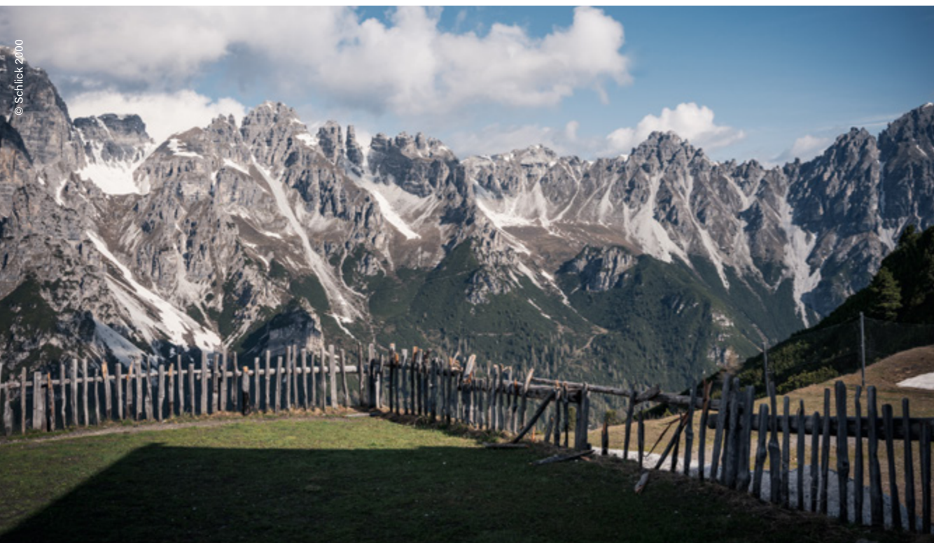
Telfes im Stubai, Kalkkögel, Schlick 2000

Un Eldorado per gli amanti dello sport sia d'estate che d'inverno. Il comprensorio Schlick 2000 si trova a soli 10 minuti da Innsbruck; l'area si estende sui pendii della splendida alta valle dello Schlick fino al Kreuzjoch a 2.140 metri. In inverno ci sono 22 chilometri di piste e 19 discese , mentre d'estate l'area conquista con sentieri escursionistici tematici per famiglie come il sentiero delle case sugli alberi o il sentiero dei dischi di legno. La stazione a monte si trova a 2.136 metri sul livello del mare ed è affiancata dall'imponente massiccio dei Kalkkögel. 500 metri più in alto si trova la cima dell'Hoher Burgstall, una delle 7 cime dello Stubai. Uno degli alpinisti più famosi ad averla scalata: Sir Edmund Hillary.