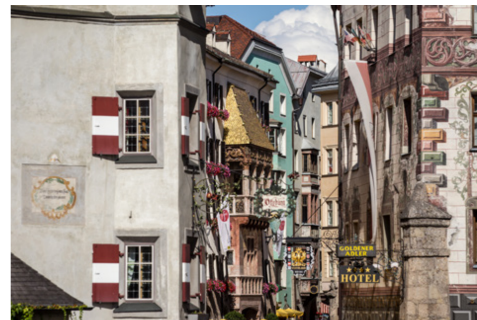
Centro storico di Innsbruck

Centro storico barocco e imponenti formazioni calcaree: il secondo giorno di gara non potrebbe essere più vario. Tra i 45 chilometri e i 3.132 metri di dislivello che separano il punto di partenza presso il Landestheater di Innsbruck e l'arrivo al centro del villaggio di Neustift nella valle dello Stubai, non mancano numerosi luoghi da amare.