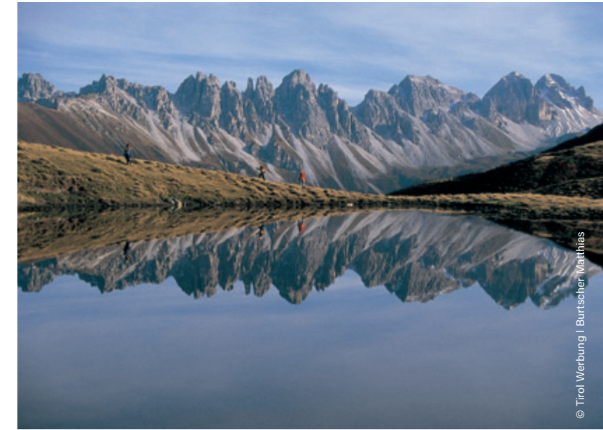
Sellrain, Salfeins See