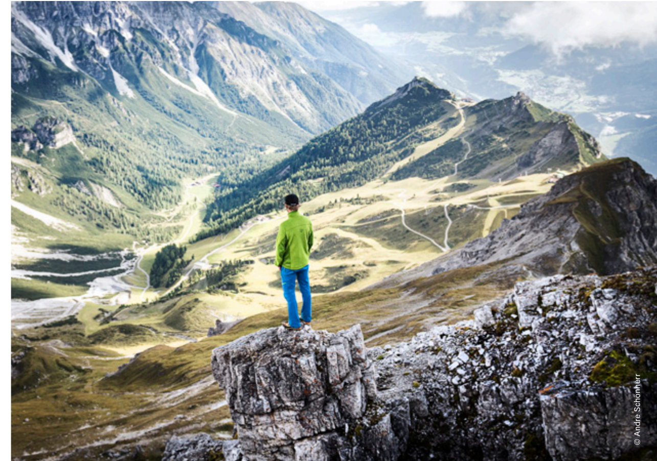
Telfes im Stubai, Schlick 2000