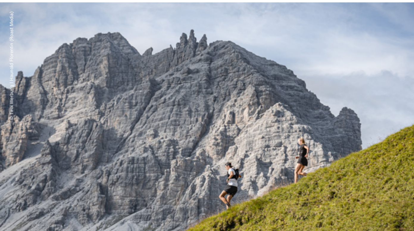
Neustift im Stubaital, vicino al rifugio Starkenburger Hütte