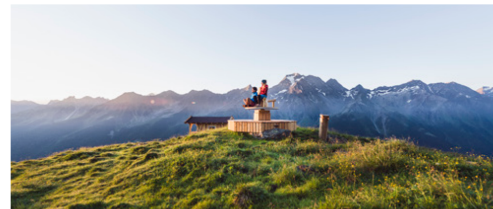
Neustift im Stubaital, scena naturale Hühnerspiel

Dove si trova la più bella vista sulle montagne del Tirolo? I pareri sono discordanti, ma questo posto è sicuramente tra i primi: il pianoro sottostante la Brennerspitze è straordinario. Qui si può ammirare un panorama montano a 360 gradi e, a inizio estate, il corteggiamento dei fagiani di monte ( Lyrurus tetrix ). I corridori tornano a Neustift lungo la "Stubairunde" prima di affrontare la Starkenburger Hütte.