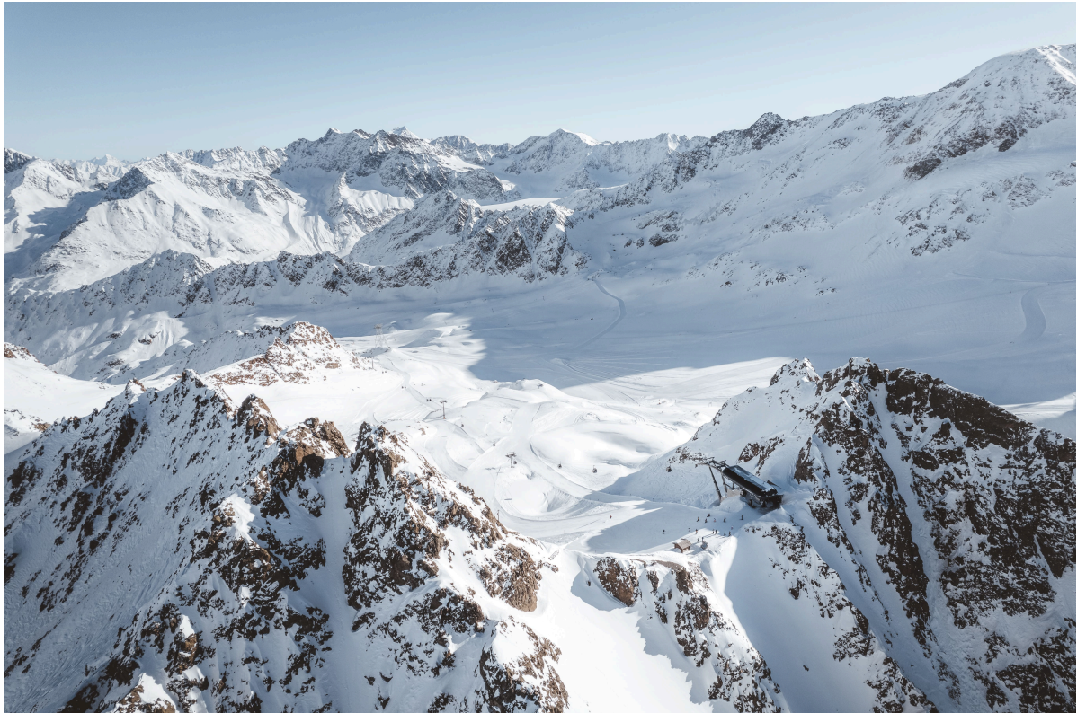
Traumhafter Ort für die Internationalen Bergführermeisterschaften, die nach 40 Jahren wieder ins Kaunertal zurückkehren.