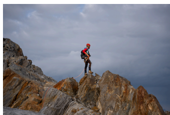
Immer alles im Blick: Die Kaunertaler Bergführer kennen gefühl jeden Felsen.