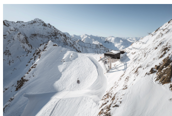
55 Pistenkilometer stehen im Skigebiet des Kaunertaler Gletschers zur Auswahl.