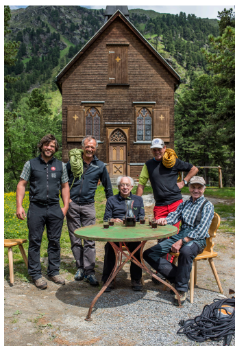
Ein Job mit Leidenschaft: Kaunertaler Bergführer heute.

Weitere Informationen: www.kaunertal.com