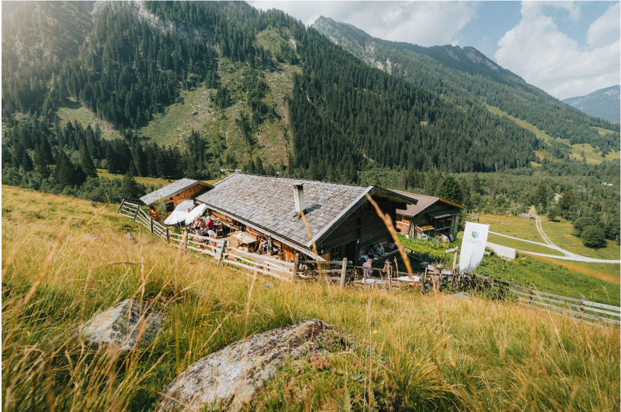
Helgas Alm im Valsertal – Zentrum der Schule der Alm – Das über 300 Jahre alte Gebäude dient als Kurs- und Begegnungsort für alle Veranstaltungen der Schule der Alm.