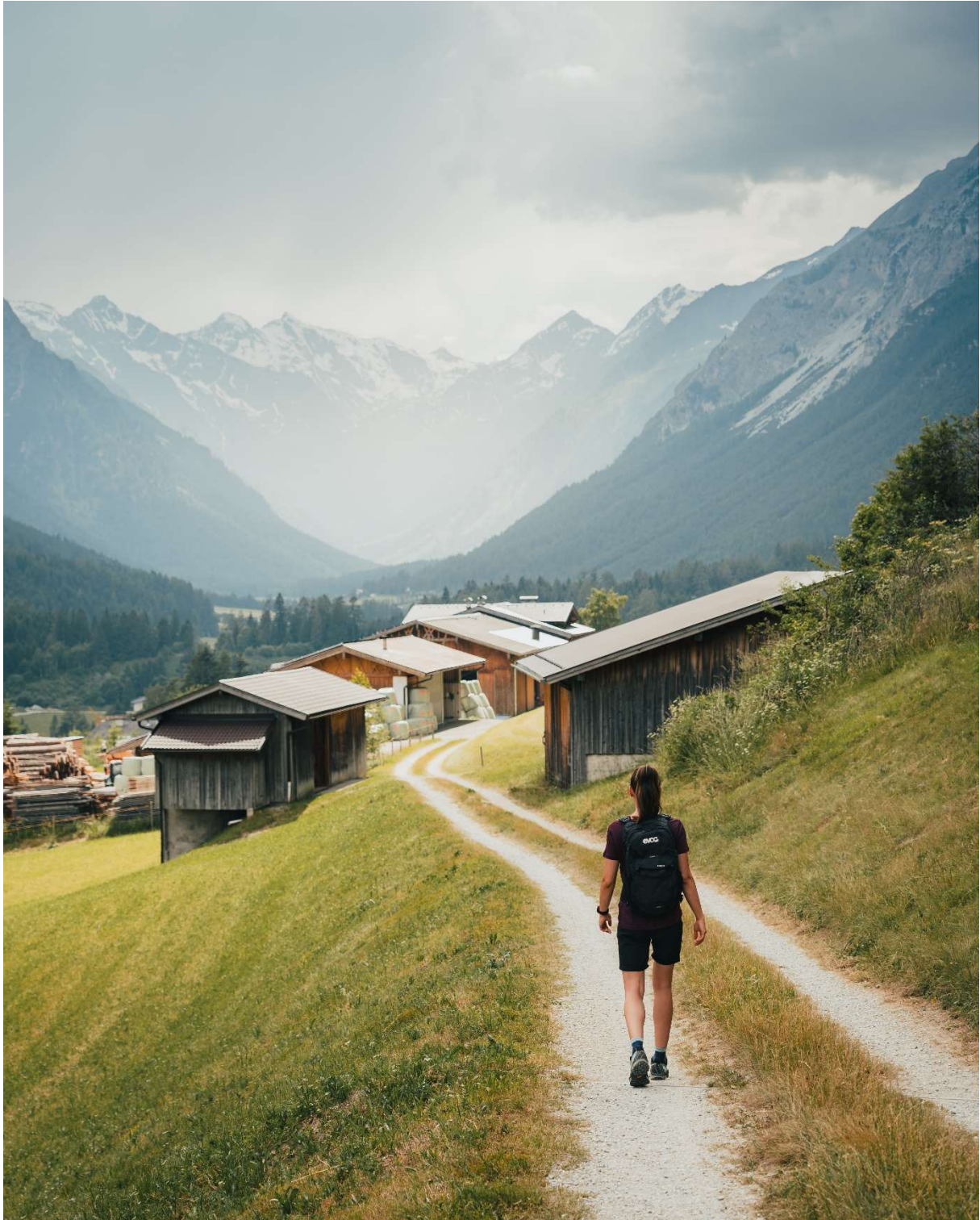
Die umliegende Landschaft des Wipptals bietet Gästen des Wienerhofs unmittelbaren Zugang zu naturnahen Wegen und stillen Ausblicken – ideal für aktive Pausen oder bewusste Auszeiten.