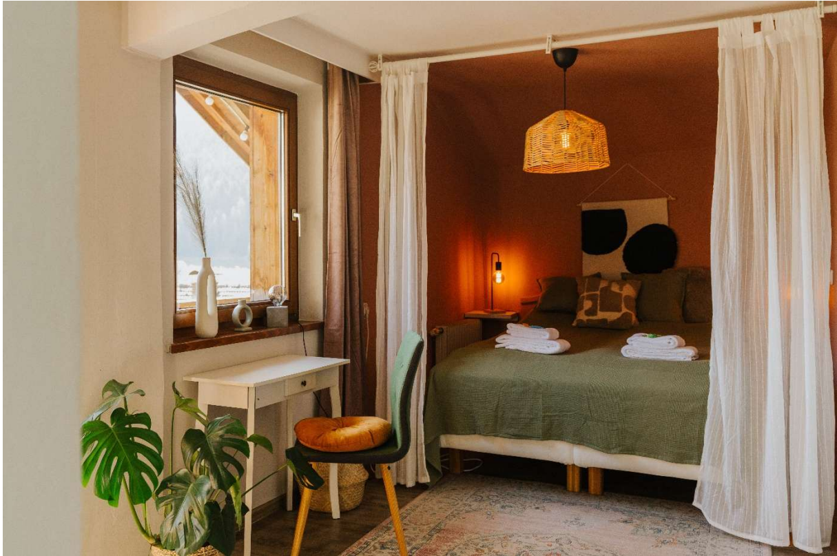
Eines der individuell gestalteten Zimmer im Wienerhof: Warme Farben, natürliche Materialien und Bergblick schaffen eine ruhige Umgebung für Rückzug, Erholung oder fokussiertes Arbeiten.