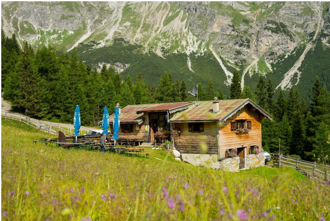
Die Steiner Alm oberhalb des Obernberger Sees – beliebtes Wanderziel und Einkehrmöglichkeit mit regionalen Schmankerln und hausgemachtem Almkäse.